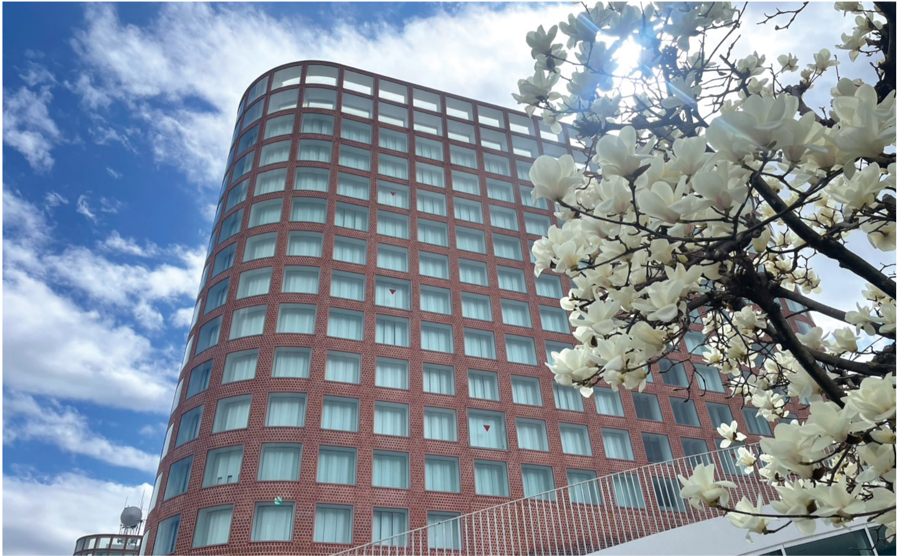
▲福生市役所とハクモクレン