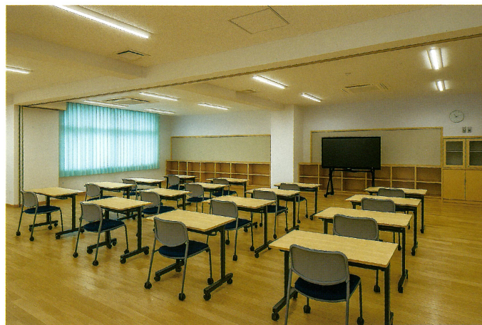
教室はスペースを区切り少人数での学習に対応できます。