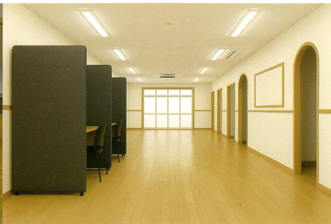
個別学習スペース： 一人の空間を確保する個別ブース