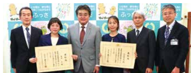
▲文部科学大臣優秀教職員表彰を受賞