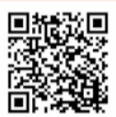
▲教育方針の全文はこちら