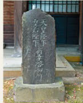
▶ 당시 천황 내외분이 다녀간 기념비

도쿄 서쪽의 만찬에서 세계 주요 인사들에게 제공된 도쿄의 명주 '가센'의 주조장. 에도 시대 후기 1822(분세이 5년)년에 창업한 드넓은 부지 내에는 문화재로 등록된 역사적인 건축물들이 자리하고 있습니다. 2016(헤이세이 28년)년, 당시의 천황 황후 폐하가 그 안에 있는 건물 중 한 곳에서 휴가를 보내셨습니다.