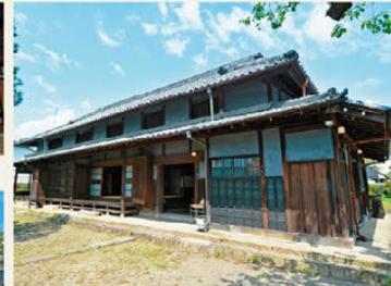
▶2012년까지 사람이 거주했다 ▶뒤에 있는 공간도 등록된 유형 문화재