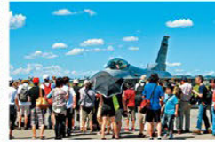
요코타 기지 미일우호 축제