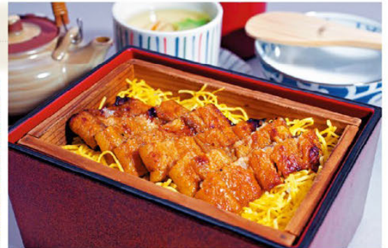
일본산 명품 장어 모듬 점심 코스는 3300엔 넓은 일본 정원에는 다마가와 상수의 분수가 흐르며, 사계절의 정서를 느낄 수 있다