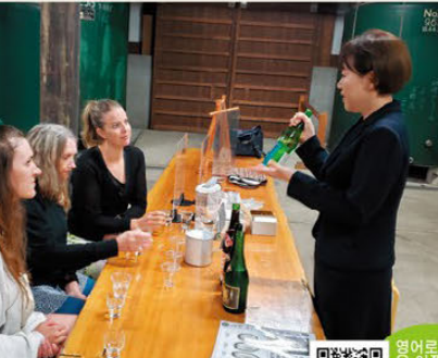
☞외국인을 위한 영어 견학도 있다(예약 필요)