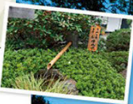
☞사용하는 물은 지하 150m에서 끌어올린다

구마가와 분수와 다마가와 상수. 두 강가를 산책하며 풍부한 자연을 느낄 수 있는 코스. 주조장과 사찰을 즐기면서 옛 구마가와 마을의 역사를 따라가 보세요.