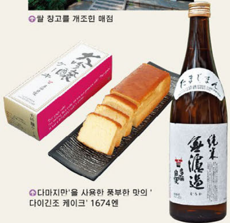
☞다마지마'를 사용한 풍부한 맛의 '다이진조 케이크' 1674엔