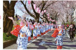
홋사 벚꽃 축제