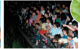
홋사 반딧불이 축제