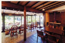
☞실내 좌석은 50석