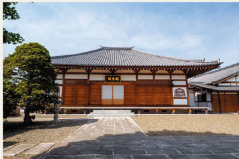
○임제종 겐초지마의 절. 시 이름과 같은 한자를 쓰지만, 이곳은 '후쿠쇼인'이라고 읽는다