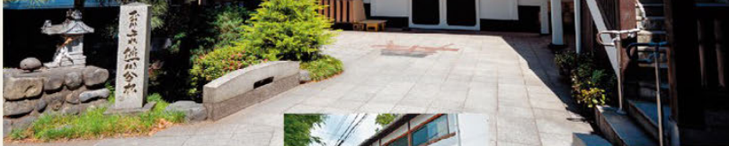
☞국가 등록 문화재로 니시타마 지역 최대급인 본 공간 ☞흰색 벽의 역사적인 건물