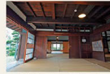
▶방에 올라가서 견학도 가능