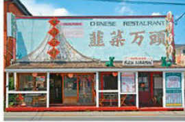
분위기가 있는 간판