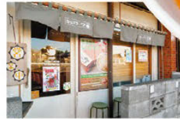
지역 주민뿐만 아니라 전국에서 라멘 애호가들이 찾는 맛집