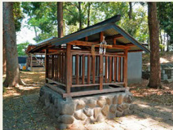
▶'가센'의 유래가 된 물물 ▶4개의 공간 중 3개가 문화재. 오래된 것은 지은 지 약 200년

옛날 중심가였던 슈쿠바시도리에 지어진 일본 가옥. 다무라 주조장에서 분가된 집으로 1902(메이지 35년)년에 지어졌습니다. 넓이는 약 270㎡, 목조 단층집 구조의 큰 건물로, 6개의 방 주변을 복도가 둘러싸고 있는 전형적인 일본 가옥입니다. 메이지 시대의 모습을 오늘날까지 전해주고 있는 귀중한 건물로서 국가 유형등록 문화재로 등록되어 일반에 공개하고 있습니다.