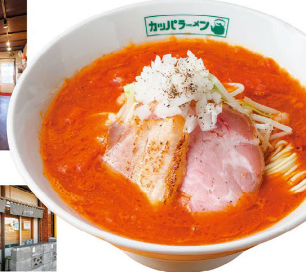
2종류의 치슈가 토피된 토마토리멘 880엔