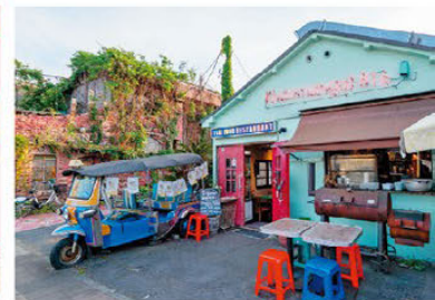
국도 16쪽에 인접해 있다