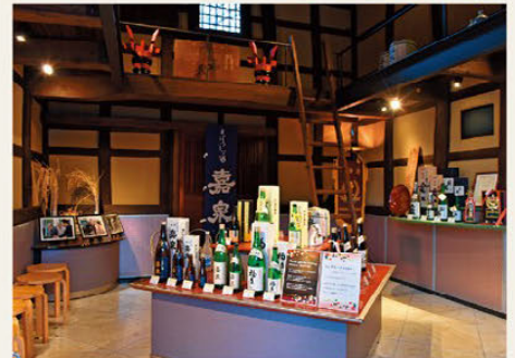
▶상품은 옆 사무실에서 구매할 수 있습니다. 다무라 주조장을 대표하는 종목 '가센'은 보통주부터 다이진조까지 마려되어 있습니다.