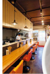
총 12석의 모던한 가게

시그니처 메뉴인 토마토리멘은 해산물과 돈코츠 국물, 토마토의 감칠맛이 어우러져 깊이 있으면서도 담백한 맛에 중독성이 있습니다. 남은 국물을 치즈밥을 넣고 리소토처럼 만들어 먹는 것도 별미. 진한 해산물 라멘도 인기입니다.