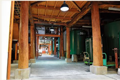
▶ 공간 내부도 견학이 가능(예약 필요)