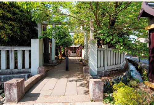
○신사 옆에는 다마가와 상수에서 끌어온 구마가와 분수가 흐른다 ○후쿠오시 구마가와 660 ○042-551-0720 ○참배 자유 ○무휴 ○JR 하이지마역에서 도보 15분 ○있음 MAP P.16 B-4

헤이안 시대 초기에 기원을 둔 녹음이 풍부한 신사. 한 신사에 모든 칠복신이 모셔져 있는 것으로도 유명하며, 7가지 복운을 받을 수 있다는 칠복신 순례도 가능합니다. 이곳에서 받을 수 있는 도장은 귀엽다는 평을 듣고 있습니다.