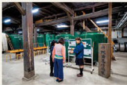
☞1880년(메이지 13년) 건축된 본 공간 내부

매월 열리는 감사데이(넷째 주 토요일과 이어지는 일요일, 공휴일)에 진행되는 주조장 견학이 인기입니다. 매월 주제와 내용도 달라지므로 자세한 내용은 웹사이트( https://www.tamajiman.co.jp/tour/ )에서 확인해야 하며, 예약은 온라인으로만 가능합니다.