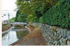
▶ 부지 바로 옆에 흐르는 다마가와 상수