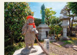
○관음상과 사랑스러운 세심동자 상에게도 참배하자