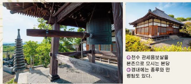
○후타시 구마가와 20 ○042-551-3062 ○8:00~17:00 ○무휴 ○JR 하이지마역에서 도보 16분 ○있음 MAP P.16 B-4

1615(겐나 원년)년에 개장된 임제종 겐초지마의 사찰. 자모관음상이 서 있는 경내에는 다마가와에서 상쾌한 바람이 불어오며, 새소리도 들립니다. 17개의 석조물이 후타시 유형 민속문화재로 등재되어 있습니다.