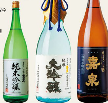
▶준마이진조 1800ml 3410엔