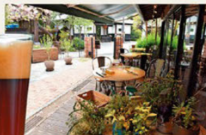
☞테라스 좌석은 40석 ☞갓 만든 맥주, 페일 에일(좌), 흑맥주(우), 각 600엔