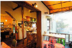
구 미군 주택을 리뉴얼한 배상 내부

오코타 기지 앞에 있으며, 블루 컬러의 샴촌 특색이 눈에 띕니다. 태국의 포장마차를 방문한 듯한 분위기 속에서 정통 태국 요리를 맛보실 수 있습니다. 특히 점심시간에는 실속 있는 세트 메뉴가 인기이며, 아이 테이블까지 손님들로 넘쳐납니다.