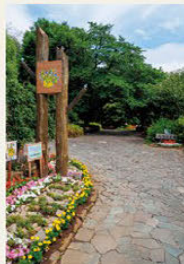
○후타시 구마가와 1359-1 ○JR 구마가와역에서 도보 5분 ○없음 MAP P.16 C-3 ○다마가와 상수를 산책하다가 들르고 싶은 곳

이 특이한 이름은 다마가와 상수를 개척했을 당시 아무리 파내도 자갈층이 물을 흡수해버렸기 때문에 '미즈쿠라이도(물을 먹어버리는 토양)'라고 불리게 된 것에서 유래했다고 합니다. 그 해자지는 지금도 볼 수 있습니다.