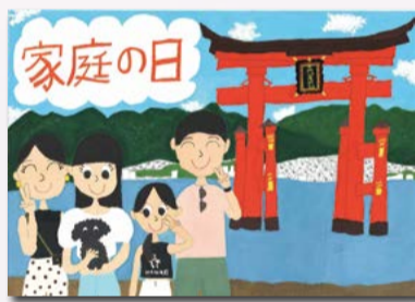
【二席】 田村梨名 (四小4年)