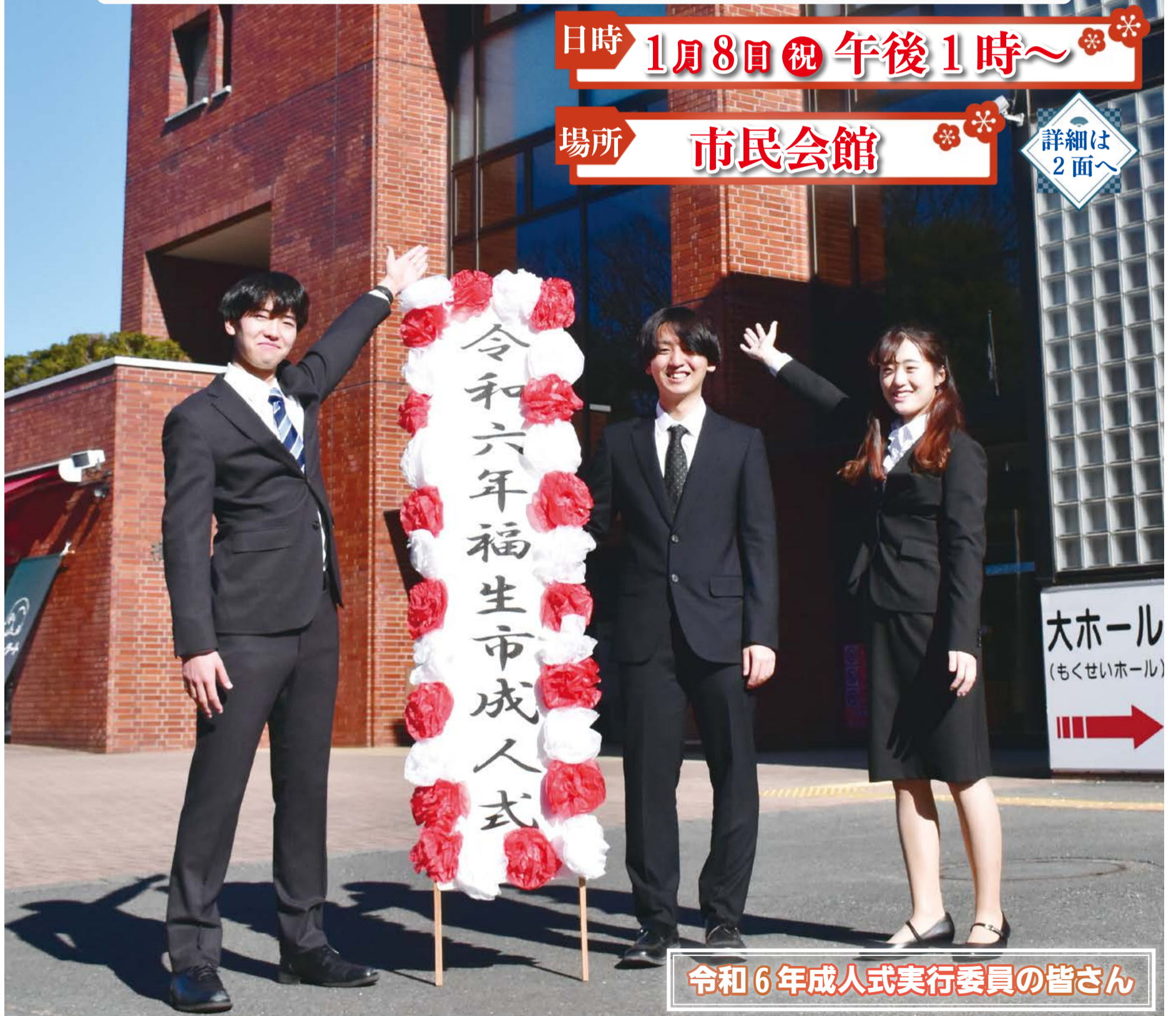
令和6年成人式実行委員の皆さん