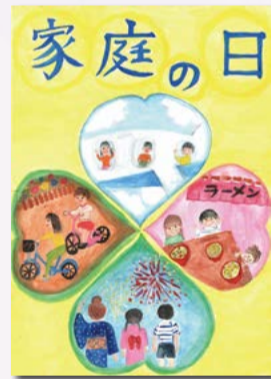
【二席】 北島心渚 (五小4年)