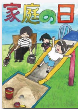
【一席】 竹田結 (五小4年)