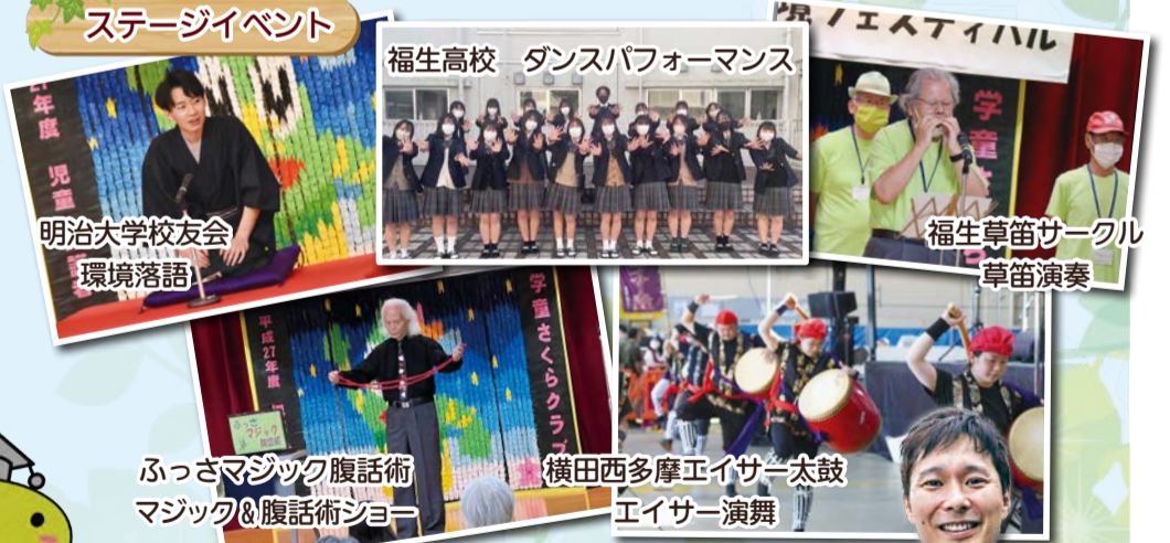
明治大学校友会 環境落語