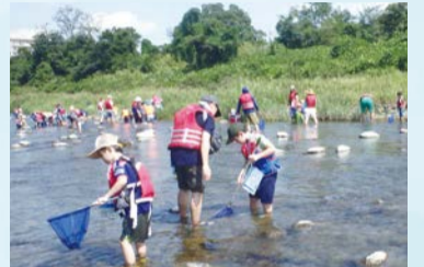
▲令和4年度の活動の様子