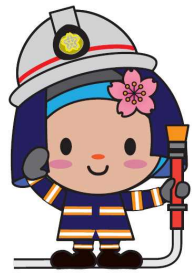
Nhân vật chính thức của TP. Hamura はむりん