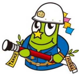
Nhân vật chính thức của TP. Fussa TAKKE☆☆