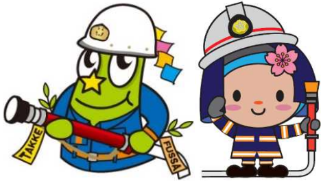
Opisyal na mascot ng siyudad ng Fussa TAKKE☆☆