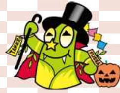
福生市公式キャラクター たっけー☆☆