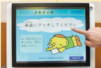
1 画面にタッチしてスタート