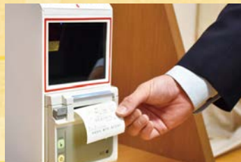
6 レシートを受け取り、貸出完了!