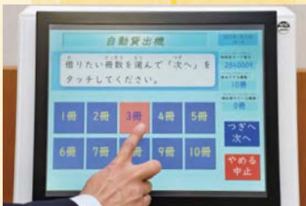
4 借りる本の冊数を押す