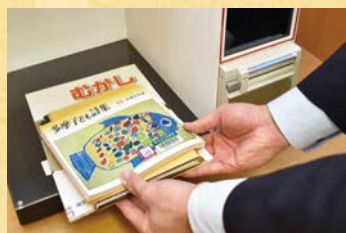
3 借りる本を台の上に置く