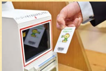
2 利用カードのバーコードを読み取り機にかざす