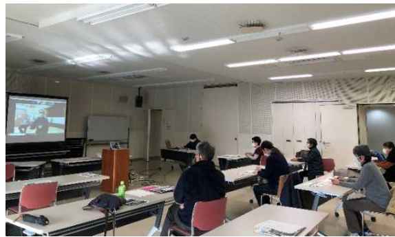
▲発表会当日の様子 講座で初めてZoomを活用

2月19日には、公民館3館をZoomで繋ぎ、3館合同の学習成果発表会をリモートで開催し、参加者の皆さんが、各館で学んだことを工夫して発表しました。公民館では、今後も様々なテーマで「デジタルシニアを目指す」講座を実施する予定です。