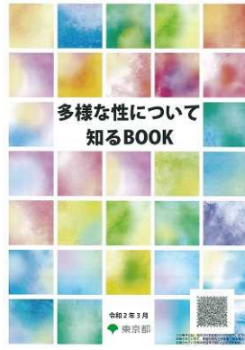
▶パンフレット表紙

今回の展示は、東京都が発行するパンフレット『多様な性について知るBOOK』から引用したものです。こちらのパンフレットはお渡しすることができませんので、興味のある方は、ぜひ公民館本館へお越しください。