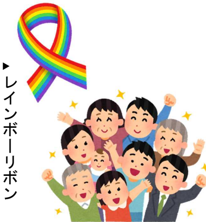
▶レインボーリボン