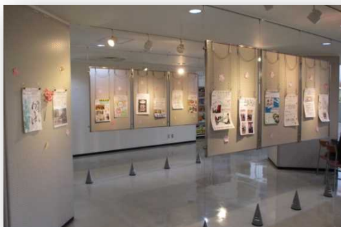
個性豊かなカタログが並びます!

令和3年度は、利用者連絡会主催の行事がほとんど中止となる中、利用者連絡会運営委員会では、サークル壁カタログ大会を開催することとなりました。