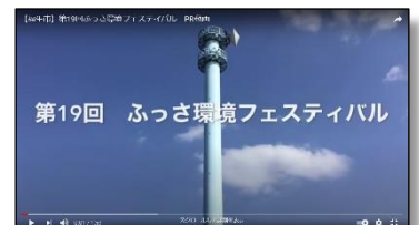
▲動画のオープニングシーン

併せて、マップや動画、画像等からヒントを得て回答が可能となる「ふっさ環フェスクイズ」を実施し、発信情報を積極的に見てもらえるよう取り組み、これをきっかけに参加事業者・団体だけでなく、広く市民等の環境への意識醸成を図ります。なお、開催期間が 1 か月あることから、期間中にクイズを追加するなど、開催期間を最後まで楽しんでもらえる工夫も準備しています。