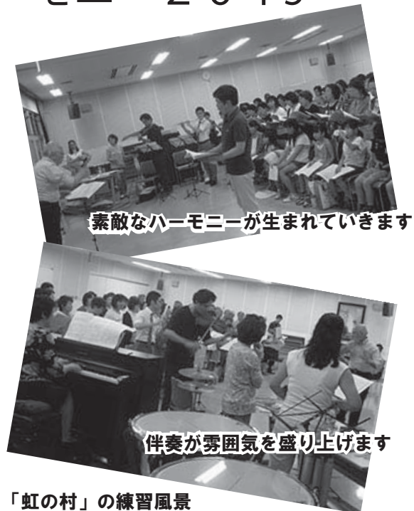
「虹の村」の練習風景