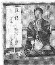
こころ亭久茶さん

どうぞお気軽に、公民館本館に来てみてください。職員もさくら会館の事務所で待っています！