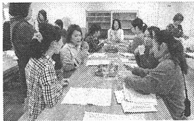
講座「ナチュラルに暮らしを楽しむ」

今号では、皆さんの身近にある公民館本館をぜひ利用していただきたい！と考え、御紹介します。講座を受ける、施設を利用する、ぜひのぞいてみてください。（施設案内は2・3ページ、講座のお知らせは4ページに掲載しています。）