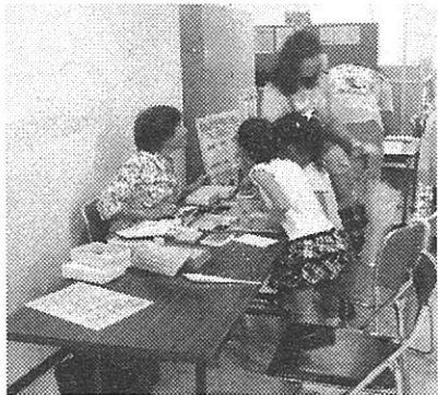
◀ 展示の体験コーナー 今年もあります

7月20日（土）・21日（日）は、様々なサークル活動の成果を ご覧にぜひ公民館本館へお越しください！！