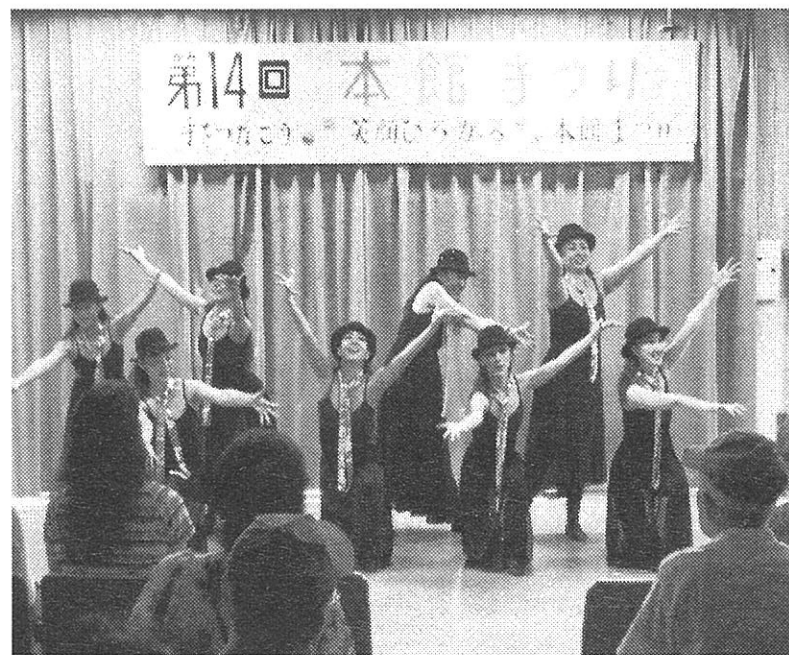
▲ ダンスが綺麗にきまったところ（昨年の演示から）