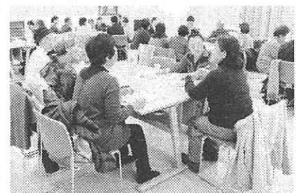
▲グループでの話し合いの中では、公民館の利用やサークル活動に関する情報交換、今後の展望や課題について、積極的に話し合っていました。

●福生市公民館のホームページ(福生市ホームページ内公民館のページ) 市ホームページ http://www.city.fussa.tokyo.jp/ 「教育」→「その他の教育関連」→「公民館」