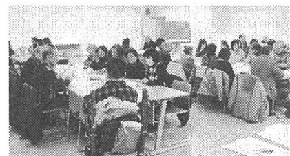
▲2月11日(土)第6回連絡会の様子。サークル間が関わる機会が少ないので会議の中で自己紹介や議題に関する意見交換を行ない、サークル同士の交流を図っています。