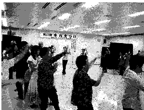
▲昨年の本館まつりエンディングの様子

セーフティキッズ (子どものための安全学習) むかし遊び(竹馬・缶ポックリ・こま・けん玉) ペーパークラフト ロープワーク ※26日(日)のみ 草笛教室(12:00から13:00まで)