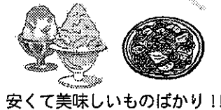
安くて美味しいものばかり!!

焼きそば 天ぷらそば フランクフルト みそ田楽 ガーリックポテト かき氷 マドレーヌ おしるこ ポップコーン コーヒー(ホット・アイス)