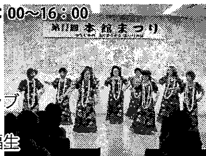
▲昨年の演示部門の様子