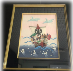
▶ 押絵サークルみっちゃん会の