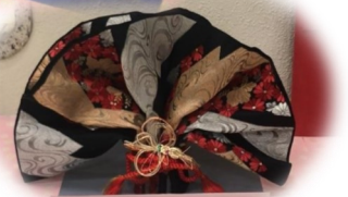
▲サークルおてだま