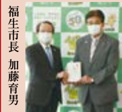
熊川保育園で使用するお散歩カーの寄贈式にて