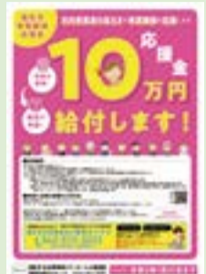
▲事業案内ポスター