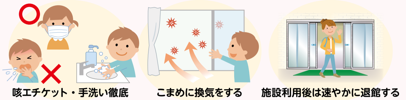
咳エチケット・手洗い徹底