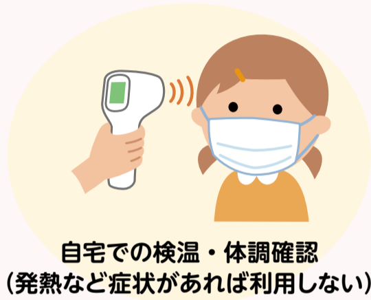
自宅での検温・体調確認 (発熱など症状があれば利用しない)