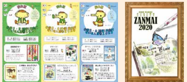
▲『福生版すいせん図書2020』 小学校低学年・中学年・高学年向け

図書館と学校司書がおすすめする小・中学生用福生版すいせん図書リストが完成しました。 市内図書館でリストの配布と紹介本の展示を行います。ぜひご覧ください。 問合せ 中央図書館 ☎553・3111