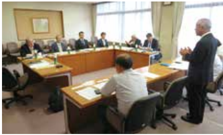
▲美濃加茂市の多文化共生の推進等について視察

②豊田市の「子どもの権利相談室」は、平成19年に施行された「子ども条例」に基づいて、平成20年に子どもの権利擁護委員とともに設置された。電話や面談等で、子どもと子どもに関する相談に応じている独立した機関。子どもからの相談に対しては、子どもと一緒に考え、子どもの最善の利益となる解決を目指している。