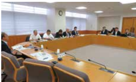
▲大府市の認知症不安ゼロ作戦について視察

②豊田市の「子どもの権利相談室」は、平成19年に施行された「子ども条例」に基づいて、平成20年に子どもの権利擁護委員とともに設置された。電話や面談等で、子どもと子どもに関する相談に応じている独立した機関。子どもからの相談に対しては、子どもと一緒に考え、子どもの最善の利益となる解決を目指している。