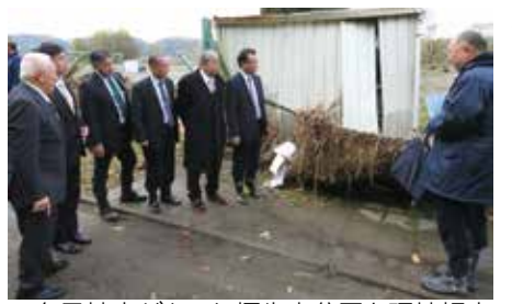
▲台風被害があった福生南公園を現地視察

工事業者及び責任技術者の登録要件が変更になるが、確認はいつ行われるのか。 答 新規については申請時、既存のものについては更新時に要件を満たすかどうかの確認をしている。 ◇福生都市計画事業福生田園西土地区画整理事業施行規程を定める条例を廃止する条例 問 平成16年の換地完了後、平成21年度に残っていた事務を行った、とのことだが内容は。 答 平成21年度に残っていた事務は精算金に関する事務である。 ◇令和元年度福生市一般会計補正予算(第6号)建設環境委員会所管分 問 駅前喫煙所環境整備工事について、パターションの設置が困難な場所は受動喫煙が生じないような配慮はされるのか。 答 喫煙場所の灰皿から離れた広範囲な場所での喫煙が見受けられることから、喫煙エリアの設定に加えて、ピクトグラムによるエリア内での喫煙の徹底を図る。また、喫煙マナー向上のための指導や、マナーアップキャンペーンを継続実施し、受動喫煙が生じないようにしている。 ◇福生市特定教育・保育施設及び特定地域型保育事業の運営に関する基準を定める条例の一部を改正する条例 問 10月からの幼児教育・保育の無償化に伴う副食費の徴収の方法は。 答 口座による引き落としや園の指定する口座への振り込みなど、それぞれの方法で行われている。 ◇福生市学童クラブ条例の一部を改正する条例 問 臨時さくらクラブは定員が160名という大きな学童クラブになるが、どのような育成を行うのか。 答 第三小学校の増築施設の一階部分を使用する学童クラブの支援体制は40人以下が望ましいとされていることから、一階フロアを四つの支援単位に区切って育成を行う予定。