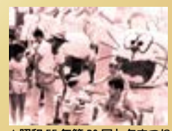
▲昭和55年第30回七夕まつり

※このほかの事業も随時お知らせします。 【問合せ】 総務課総務係 ☎ 551・1576 ▼郷土資料室からのお知らせ「古写真寄贈のお願い」 郷土資料室では記念事業に関連する展示、事業などを企画し ており、それらに用いるため、古写真の収集を行っています。 お手元に明治期から昭和期の生活の様子や建造物など、当時 が偲ばれる古写真がありましたらご寄贈ください。皆さんから のご連絡をお待ちしています。※内容によりご意向に沿いかねる 場合があります。 【問合せ】 生涯学習推進課文化財係 ☎ 530・1120