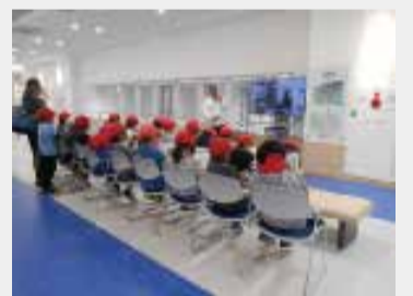
▲防災食育センターでの食育の様子

市では、環境マネジメントシステム「F-e」を運用し、環境負荷低減の取り組みを進めています。昨年度のF-e監査の中で、独自の工夫をし、高評価だった防災食育センターの取り組みを紹介します。