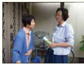
▲民生委員が訪問し、制度を紹介

●民生委員制度100周年を契機とした、民生委員による事業協力の結果、災害時要援護者（避難行動支援希望者）登録事業と、救急医療情報キット配布事業の登録者数が大幅に増加しました。