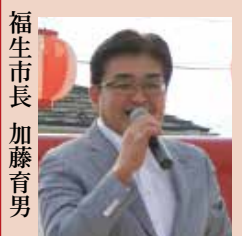
ふっさ妖怪盆踊りにて