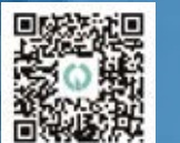
▲50周年記念事業ホームページ