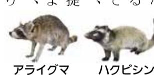
アライグマ ハクビシン

市では、アライグマ、ハクビシンに関する目撃情報等を活用した捕獲、防除を実施しています。 より効果的な取り組みとするため、これまでの情報に加え、新たな情報の提供をお願いいたします。目撃、痕跡、被害情報がありましたら次のことをご連絡ください。