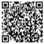
▲厚生労働省ホームページ

①平成31年4月1日以前から年金を受給している方で、対象となる方には、日本年金機構から請求手続きのご案内が9月上旬から順次送付されています。同封のはがき(年金生活者支援給付金請求書)を記入し提出してください。