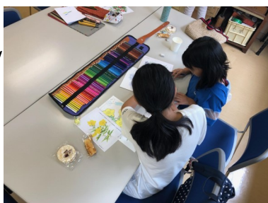
ぬり絵教室の様子