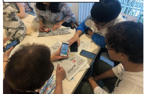
ボイストラを使った交流の様子

ボイストラは、10月12日(土)にだれでもなんでも展で体験できます。ぜひ体験をしてお越しください。時間等詳細はお問い合わせください。