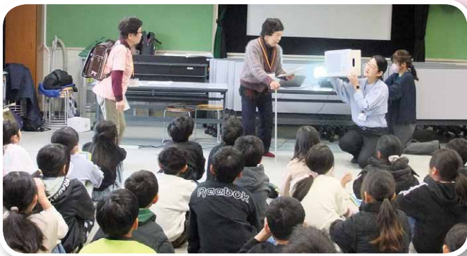
↑福生市立福生第二小学校

福生市内の小中学生が認知症サポーター養成講座を受講しました。さらに、地域の老人クラブ、小地域福祉活動、町会などでも講座を開講し、サポーターが増えています。