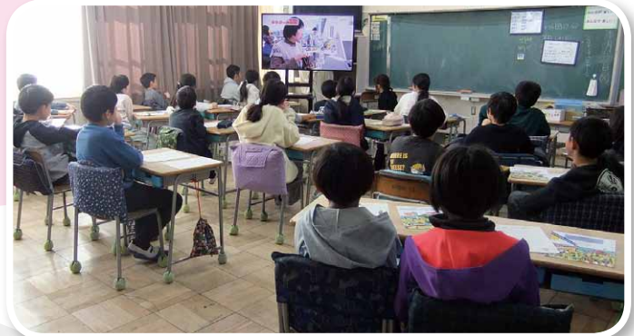
↑福生市立福生第四小学校