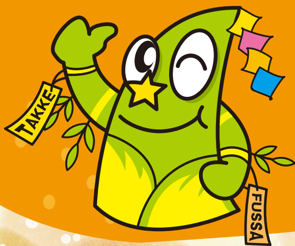
福生市公式キャラクター たっけー☆☆