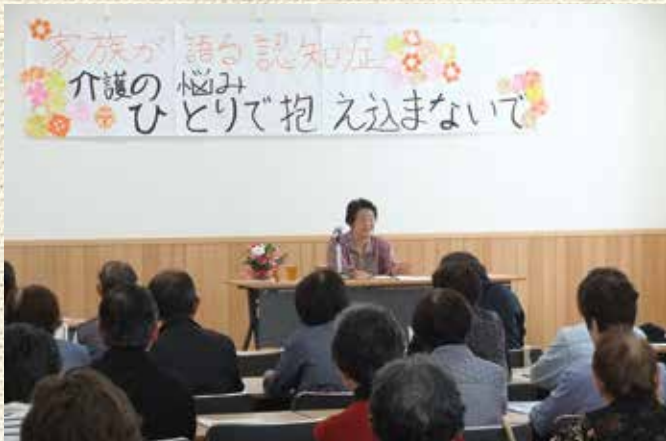
会場には大勢の方が集まりました。

「認知症の方の介護を経験されている家族のお話をききたい」という声に答え、「認知症家族の会・青梅ネット」の方をお招きし、ご講演いただきました。