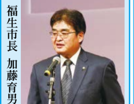
福生市長 加藤育男