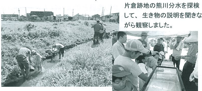
片倉跡地の熊川分水を探検して、生き物の説明を聞きながら観察しました。