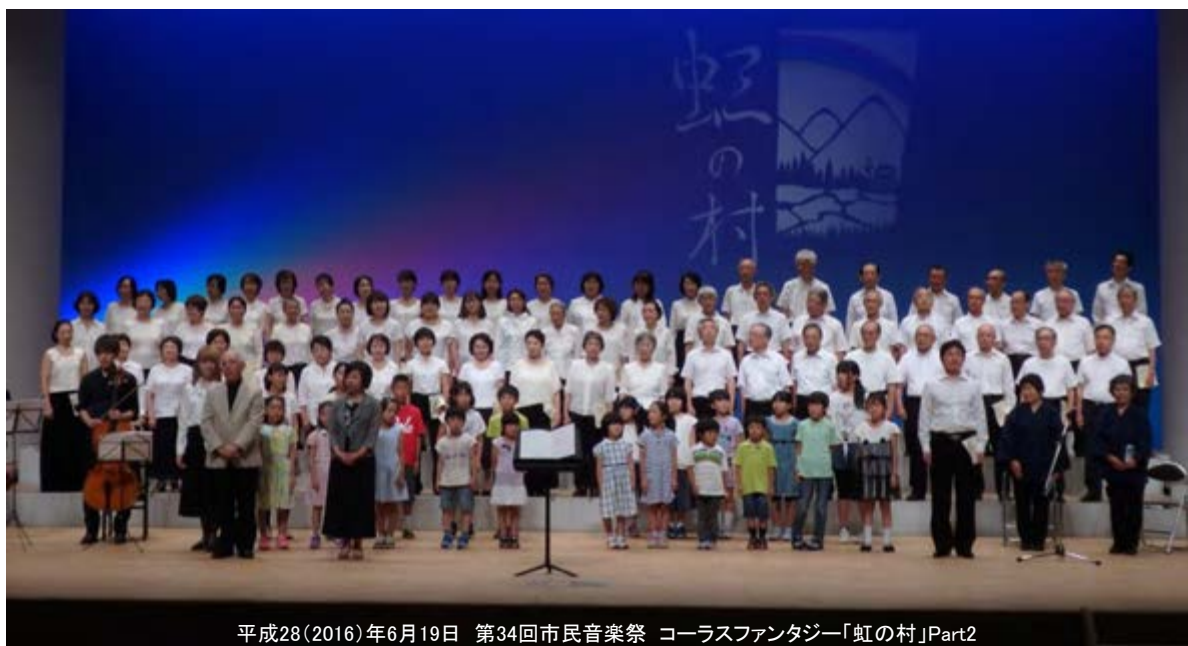
平成28(2016)年6月19日 第34回市民音楽祭 コーラスファンタジー「虹の村」Part2