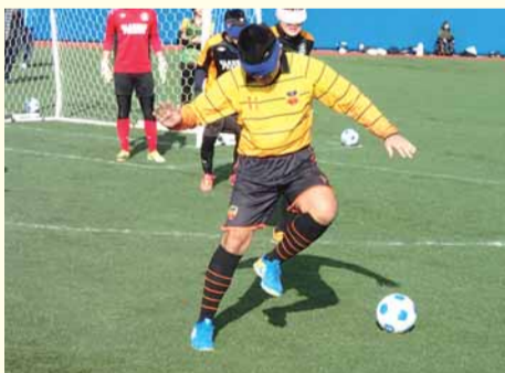
▲昨年のリーグ戦の様子