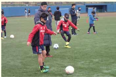
▲ブラインドサッカー体験

また、東京オリンピック・パラリンピックの開催が2年後に迫っており、パラリンピック種目でもあるブラインドサッカーを体験できる