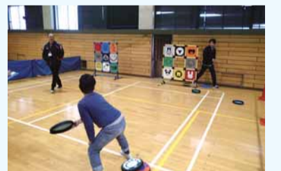
▲昨年のスポーツフェスタの様子