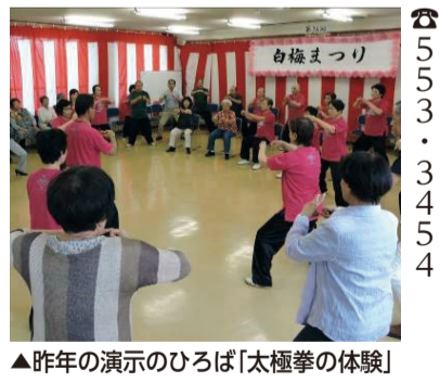
▲昨年の演説のひろば「太極拳の体験」

平成30年1月から3月までの教育委員会定例会の主な内容を紹介いたします。 第1回定例会(1月19日) 議案 ◎福生市教育委員会表彰者の決定について(他1件) 第2回定例会(2月16日) 議案 ◎新扶桑会館における防犯カメラの設置について(諮問)(他7件) 報告事項 1件 協議事項 1件 第3回定例会(3月23日) 議案 ◎福生市副校長補佐嘱託員及び学校経営補佐嘱託員設置基準の制定について(他14件) 報告事項 6件 以上の議案が審議可決されました。