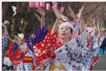
▲前回写真コンクール最優秀作品