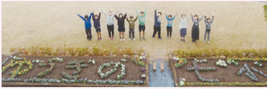
▲福生第七小学校環境委員会による作品

コンテストには総数32団体からの応募があり、厳正な審査の結果、学校の部最優秀賞は福生第七小学校環境委員会、一般の部最優秀賞は原ヶ谷戸町会が受賞しました。表彰作品は2月末まで市役所1階情報スペース付近に掲示しています。【問合せ】環境課環境係 ☎ 551・1718