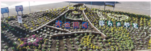
▲原ヶ谷戸町会による作品