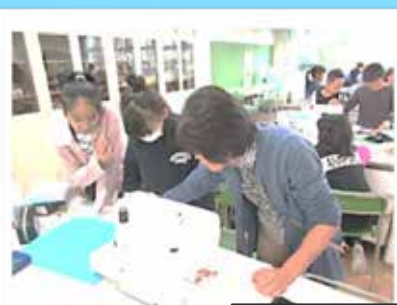
家庭科の授業(ミシン)の補助