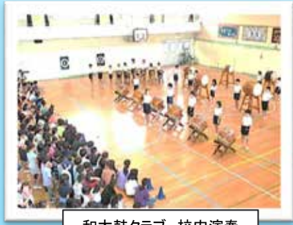
和太鼓クラブ 校内演奏