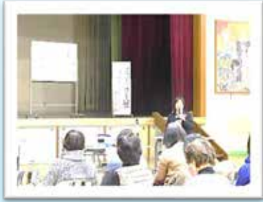
CS研修会 (文部科学省CSマイスターを招いて)