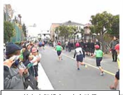
持久走記録会の安全確保

登下校の見守り、校外学習引率、持久走大会の安全確保、運動会での熱中症対策、避難所開設、防災訓練などの活動