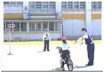
交通安全指導(自転車免許)