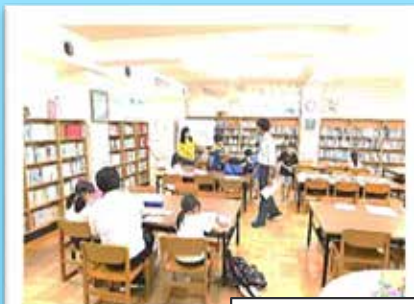
サマースクールでの学習支援