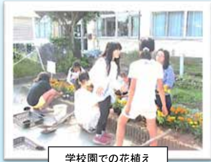
学校園での花植え