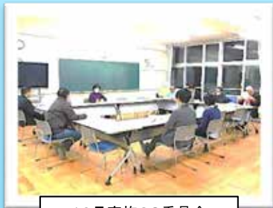
12月実施CS委員会 (学校から取組の説明)