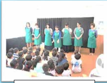
ぶっくんによる読み聞かせ