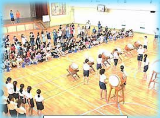
三小の伝統 和太鼓

CS委員による学校運営に関する主な意見(令和元年度) ○子供たちの良さや頑張りを認めていると感じる部分はあるが、三小全体としてさらに進めてほしい。 ○校長・副校長のもと、各担当の先生方が、それぞれの視点で適切に児童の成長に向けた取組を行っていると感じる。 ○子供たちに向き合う姿勢が評価できる。十分成果が出るまでには時間がかかると思うが、このまま進めてほしい。 ○子供たちが朝ご飯を食べて、午前中の学習や運動の充実が図れるように協力したい。子供たちの知力と体力と心の柔軟性が育まれると思う。 ○CSのことを保護者・地域の皆さんにさらに知っていただき、地域全体で子供たちを見ていく気持ちを育てていけるよう努力していきたい。