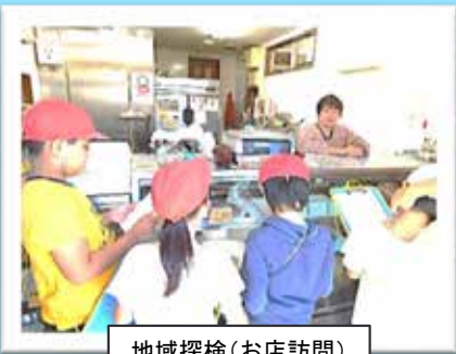
地域探検(お店訪問)