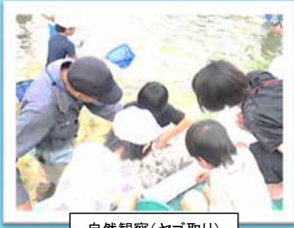
自然観察(ヤゴ取り)