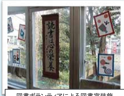
図書ボランティアによる図書室装飾