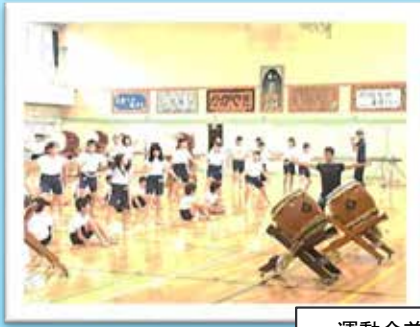
運動会前の和太鼓練習