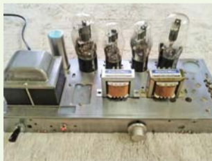
▲鑑賞に使う真空管アンプ