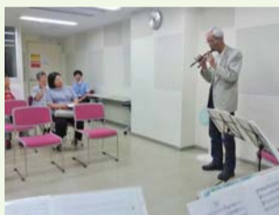
▲リコーダーミニコンサート