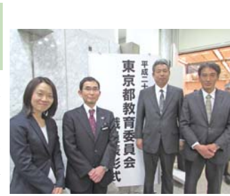
▲受賞された皆さん

2月9日(木)に東京都教育委員会表彰が行われ、次の教員・学校が受賞しました。(敬称略)