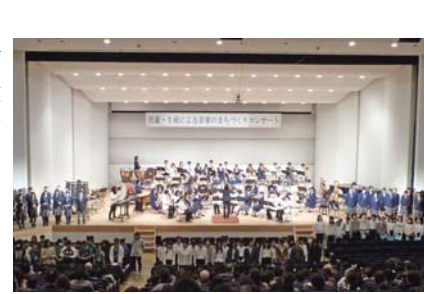
▲コンサートの様子

「合同演奏は、三校が一致団結して素晴らしかったです。」等の感想が寄せられました。