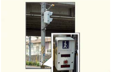
▲音響付き信号機

市長 音響付き信号機は、視覚障害 者の安全性と利便性の向上に有益であ る。福生警察署によれば、高齢者、障 害者等の移動等の円滑化の促進に関す る法律に基づき、対象経路を指定して いる場合は音響付き信号機設置が優先 されるとのことなので、対象経路の選