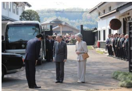
▲天皇皇后両陛下行幸啓(平成28年4月12日 田村酒造場にて)

市長 本市は、島しょの一部を除き 都内区市町村で唯一行幸啓の機会がなく、 都を通じて御視察を願い出てきた。 4月に入り宮内庁より行幸啓実施決定 の通知があり、御視察先となった田村 酒造場の御協力のもと、宮内庁の専門 官をはじめ関係者と合同会議を開催し、 9日に現地リハーサル、11日には職員