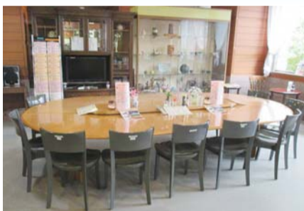
▲「オレンジカフェ」が実施されている福祉センター内のカフェ

市長 現在、4箇所の特別養護老人 ホームと社会福祉協議会が対象となっ ている。今後は介護サポーターの増員 を図るとともに、認知症対策事業の 「オレンジカフェ」、「おれんじパー ク」の傾聴ボランティア活動や、市内 デイサービス介護施設、有料老人ホー