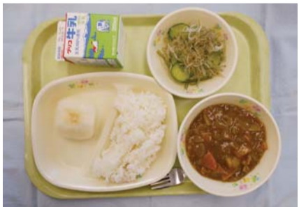
▲福生市立小学校の給食

教育長 第3子からの学校給食費無 料化の考えはない。学校給食費につい ては、学校給食法第11条第2項に基づ き、学校給食で使用する食材費として、 保護者から、養育されている児童・生 徒一人ひとりについて、負担いただい