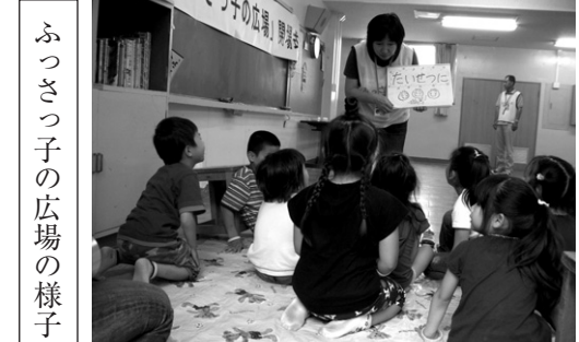
ふっさっ子の広場の様子

そのための、答弁する市職員は教育委員会の管理職のみならず全庁から担当管理職の出席となりました。それだけ、福生の児童の視野が広がっている証です。児童自らが、その成長を実感でき、福生で育ってよかったと思つたことでしょう。教職員、保護者、地域の皆様も子どもの成長を願い、指導して下さったおかげだと思います。福生市教育委員会としても誇らしいことです。