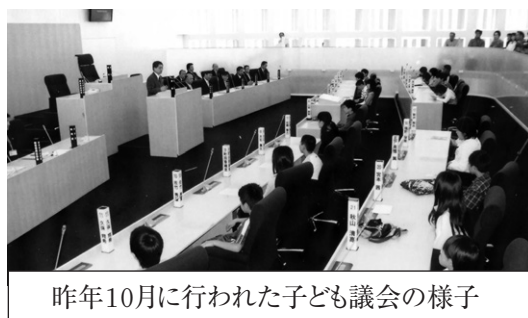
昨年10月に行われた子ども議会の様子

そのための、答弁する市職員は教育委員会の管理職のみならず全庁から担当管理職の出席となりました。それだけ、福生の児童の視野が広がっている証です。児童自らが、その成長を実感でき、福生で育ってよかったと思つたことでしょう。教職員、保護者、地域の皆様も子どもの成長を願い、指導して下さったおかげだと思います。福生市教育委員会としても誇らしいことです。