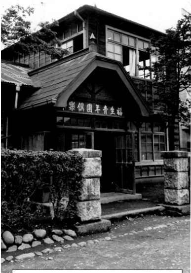
福生青年団倶楽部と門柱

登録方法や利用の仕方は、市内の図書館で配布しています。「西多摩8市町村図書館ガイドブック」をご覧ください。