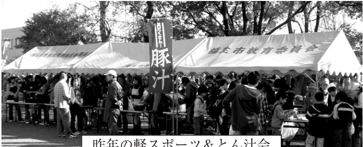
昨年の軽スポーツ&とん汁会

日程 演示10月25日(土)26日(日)11月1日(土)2日(日)3日(祝)8日(土)9日(日)展示11月1日(土)2日(日)3日(祝) 場所 市民会館公民館、さくら会館、茶室「福庵」 ※開場式11月1日(土)午前10時～市民会館小ホール(つつじホール)