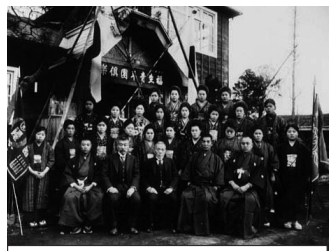
福生市青年団倶楽部落成式