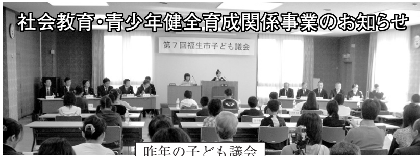
昨年の子ども議会