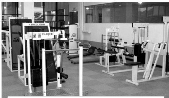
器具を入れ替えた中央体育館のトレーニング室

中央体育館・福生地域体育館にて、15歳以上（中学生除く）の方が利用できます。利用方法が多少異なりますので、初めての方は各体育館にお問合せください。