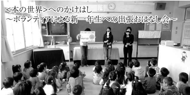
＜本の世界＞へのかけはし ～ボランティアによる新一年生への出張おはなし会～

一昨年スタートした図書館おはなし会「ぶっくん」は、現在図書館で活動しているボランティアグループ「おはなしのもり」による市内7つの小学校への出張おはなし会です。今年も6月に実施しました。大型絵本やパネルシアターなど約30分のたのしいプログラムでした。子ども達の反応もとても良く、演じる側との一体感ができ、生き生きとした表情が見られました。各学校共に好評で、本の世界の楽しさを感じてもらえたようです。また、お話をしたボランティアさんも、「楽しくお話ができました。これから本の世界に触れるきっかけづくりのお手伝いをしていきたいです。」と話しています。今後も引き続き図書館と