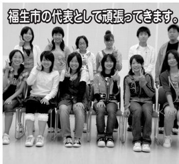
福生市の代表として頑張ります。

シアトル市では、10日間のホームステイをしながら現地の大学で英語の研修を受けます。更に現地青少年団体との野外活動を通じ異文化に対する理解と、日系老人ホーム「シアトル敬老」訪問により日本人のアメリカ合衆国への移民の歴史を学ぶとともに、交流会で日本の伝統文化を紹介して相互理解に努めます。