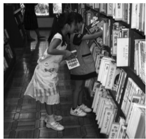
本を棚に戻す作業中

今年度は、午後2時から2時間あまりを疑似体験としてカウンター業務と返却本を棚に戻す作業、そして本の装備作業を行ってまいりました。カウンター業務は、少し緊張しながらも誇らしげに接客対応をしていたのが印象に残っています。返却本を棚に戻す作業は、一度戻す場所を覚え