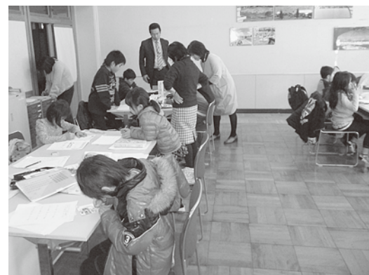
福生第一小学校の「学びの広場」放課後や夏休みなどに児童の自主的な学習をサポートが手伝っています

地域ぐるみで健やかに育むためには、多くの市民の方々のご理解とご協力が必要です。授業支援や環境整備支援をしてくださる学校支援サポーター(ボランティア)を募集しています。多くの市民の皆さんの参加をお待ちしております。