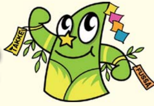
福生市公式キャラクター たっけー☆☆