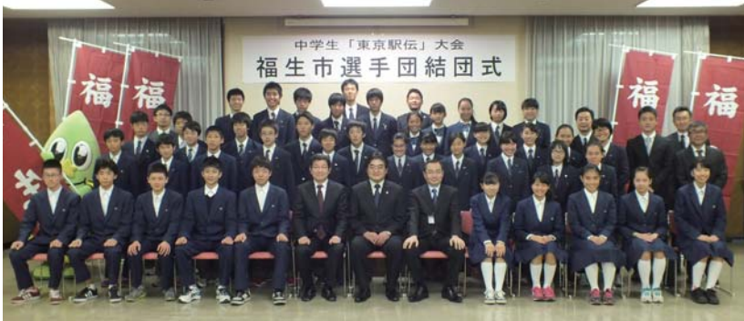
▲平成26年11月21日に「東京駅伝」福生市選手団結団式を行いました