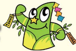
福生市公式キャラクター たっけー☆☆

—発行 編集— 福生市教育委員会 教育部 教育総務課 〒197-8501 福生市本町5番地 042-551-1511 (市役所代表)