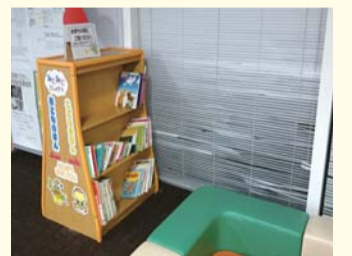
▲みにみにとしょかん

窓口の順番を待っている時間を利用して、読書はいかがですか。 本棚は「おとなのほん」と「こどものほん」に分かれています。「おとなのほん」には雑誌や生活に役立つ本を、「こどものほん」には赤ちゃんからご利用いただける絵本・読み物をご用意いたしました。ちょっとした時間の安らぎに、また親子で本に慣れ親しむ機会作りに、ぜひご利用ください。 問合せ 中央図書館 ☎553・3111