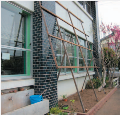
ゴーヤの棚を作りました